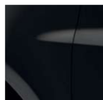
СЕДЕФЕНО ЧЕРНО (TE 676)*