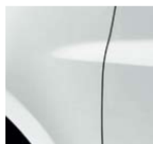
ЛЕДНИКОВО БЯЛО (TE 369)