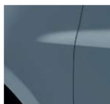
СИВО-СИНЬО (TE J47)*