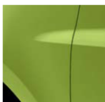
ЯБЪЛКОВО ЗЕЛЕНО (TE DNO)*