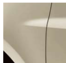
ПЕПЕЛЯВО БЕЖОВ (TE HNK)*