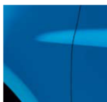
ЕКСТРЕМНО СИНЬО (TE RNA)*