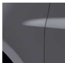
СИВ "КАСИОПЕЯ" (TE KNG)*