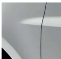
ПЛАТИНЕНО СИВО (TE D69)*